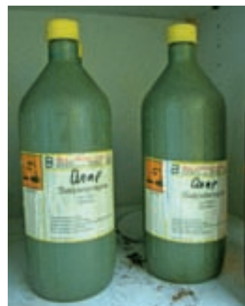
Ved ulykken på Københavns Universitet [1] sprang bunden af en grøn flaske sammen til disse. Materialet var helt hvidt og hårdt efter mange års opbevaring.

Nogle oplysninger om emballagen var præget i dunkens bund, og ud fra dem kunne bl.a. konkluderes, at dunken var af polyethylen high densitet (PE-HD) og fremstillet i juni 2003. Helt overraskende var dunken derimod ikke UN-godkendt (UN står for The United Nations packaging symbol). Om holdbar-