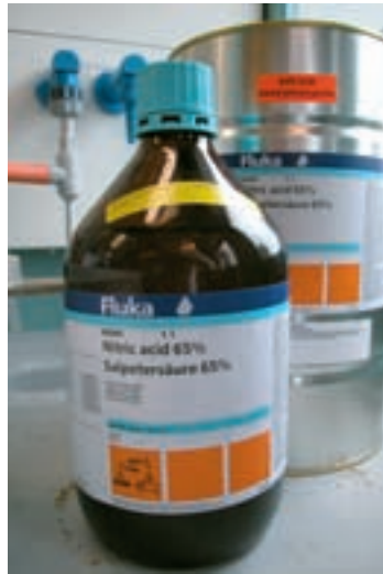
Nogle firmaer anvender coatede glasflasker til koncentreret salpetersyre, og emballagestørrelsen er højst 2,5 liter.

ADR-kravene er svært tilgængelige, og måske er transportreglerne i dette tilfælde opfyldt ved, at dunken har været forsendt i en papkasse, men brugerne efterlades med et opbevaringsproblem, fordi ingen normalt omhælder indholdet.