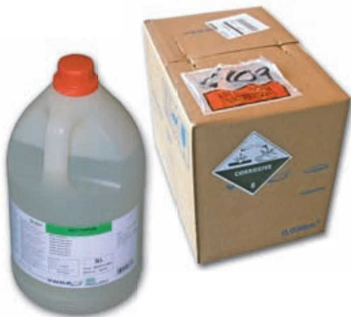
Koncentreret salpetersyre fra VWR/PROLABO leveret i en 5-liters plastdunk som ikke var UN-godkendt. Dunken var pakket og transporteret i en UN-godkendt papkasse. Transportreglerne var måske opfyldt, men om Miljøstyrelsen vurderer, at plastdunken opfylder emballagekravene, vil Styrelsen helst ikke røbe.

angivet en særlig emballagebestemmelse (PP81): Den tilladte brugsperiode for dunke er højst to år fra fremstillingsdato!